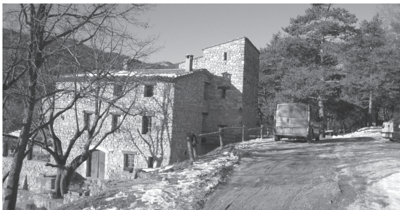
Vue côté Est où se construira l'extension du bâtiment

Le nouveau bâtiment de la chaufferie et de son silo construit en sous-sol permet de rajouter deux étages par-dessus, soit six locaux, adaptés aux personnes à mobilité réduite, qui pourront servir de