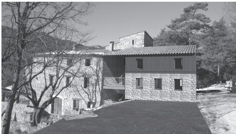
Vue identique avec l'extension prévue ainsi que l'escalier de secours